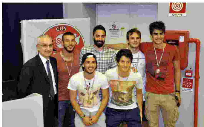
Le gare in varie discipline sportive si sono svolte sabato scorso al PalaCus di Bizzozero, coinvolgendo centinaia di studenti universitari: ieri è stato il momento delle premiazioni finali