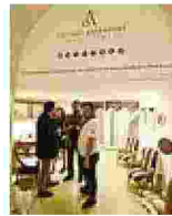
Futuro Anteriore per Daphne

■ Un evento in programma questa fine settimana a Futuro Anteriore spazio tempo.