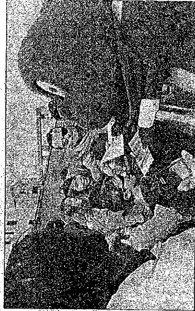
Il Gabibbo assediato dai fans accorsi allo stadio per assistere alla partita

CASTELLANZA - (s.d.m.) La vittoria della Nazionale Calcio Tv era scontata, ma non era previsto che avrebbe trovato filo da torcere: a fronte dei dieci goal subiti, la squadra M.D. Castellanza Friends è riuscita a segnare per due volte nella partita avversaria.